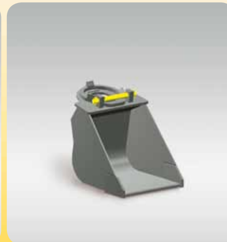
Löffel Ideal geformt und stabil gebaut für das zeitsparende Abräumen des zerkleinerten Materials.