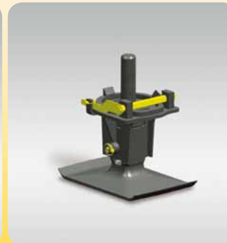
Verdichter Untergrundverfestigung leicht gemacht: Der Verdichter wird einfach am betriebsbereiten Hydraulikhammer montiert.