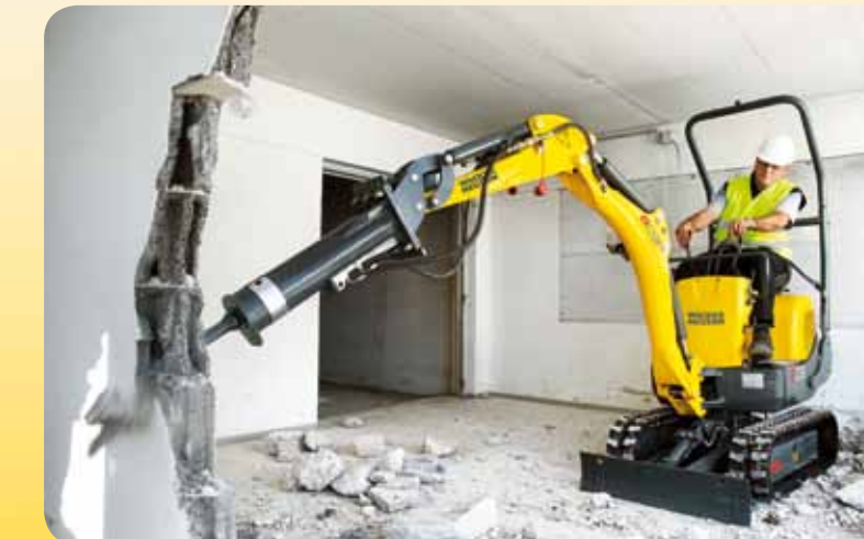
NE6 auf 803 Das optimale Gespann für Abbruch- und Renovierungsarbeiten in Innenräumen. Selbstverständlich mit allen technischen Features der großen Modelle.