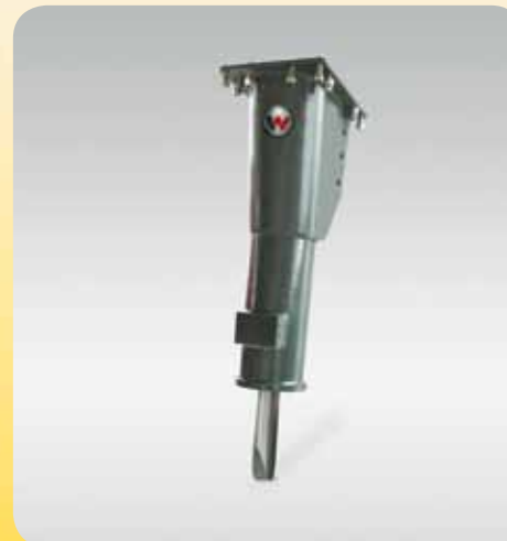
NE 50 Der Wacker Neuson NE 50: kompakte Abmessungen und höchste Leistung in der 500 kg Klasse. Für alle Anwendungsfälle optional mit Zentralschmierung und Unterwasserkit erhältlich.